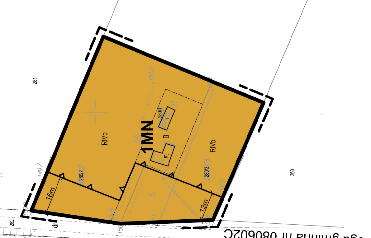
Droga gminna nr 080602C