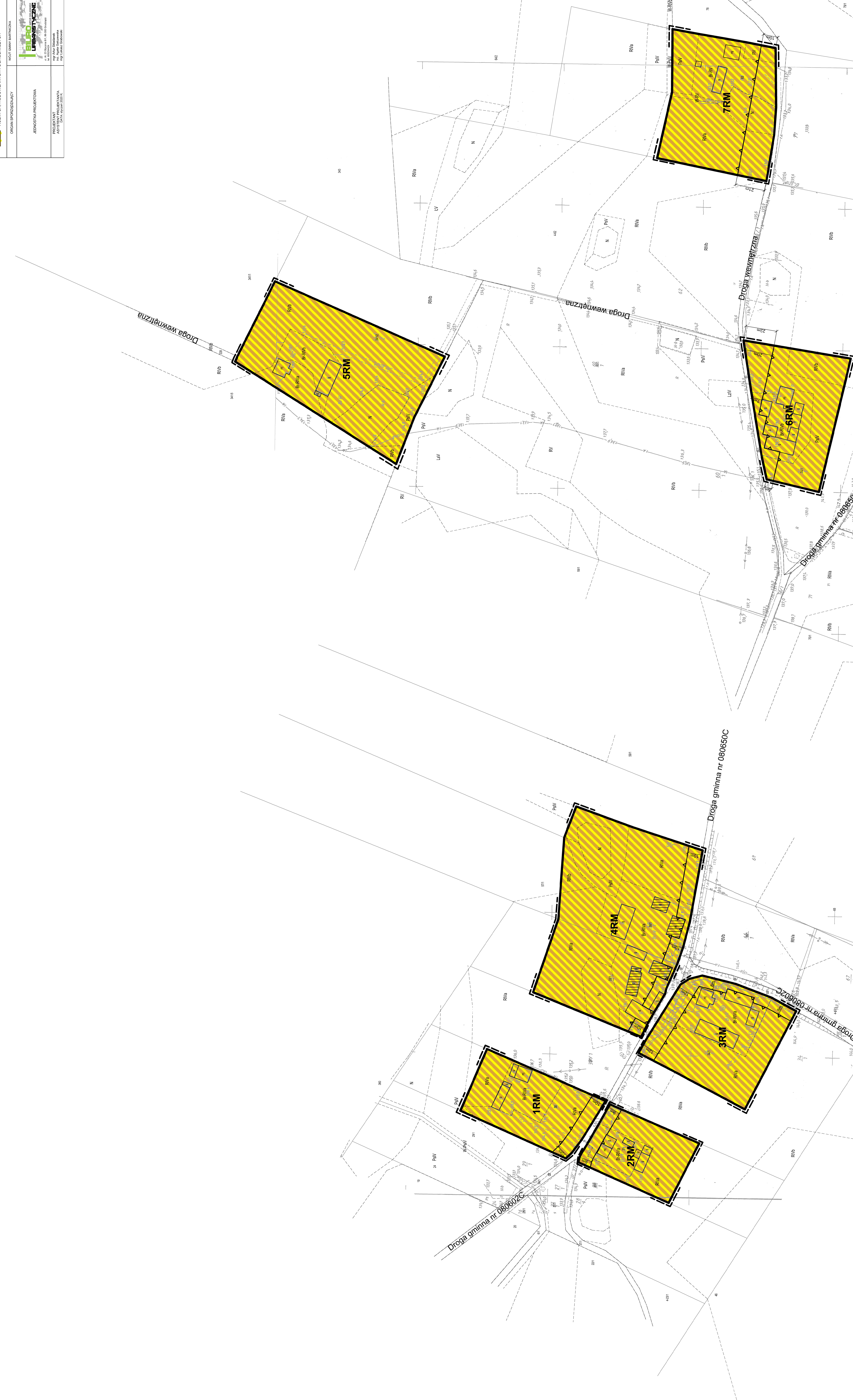
Droga gminna nr 080602C